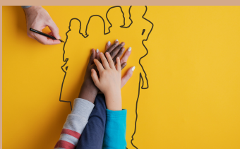
Donació de Medul·la Òssia